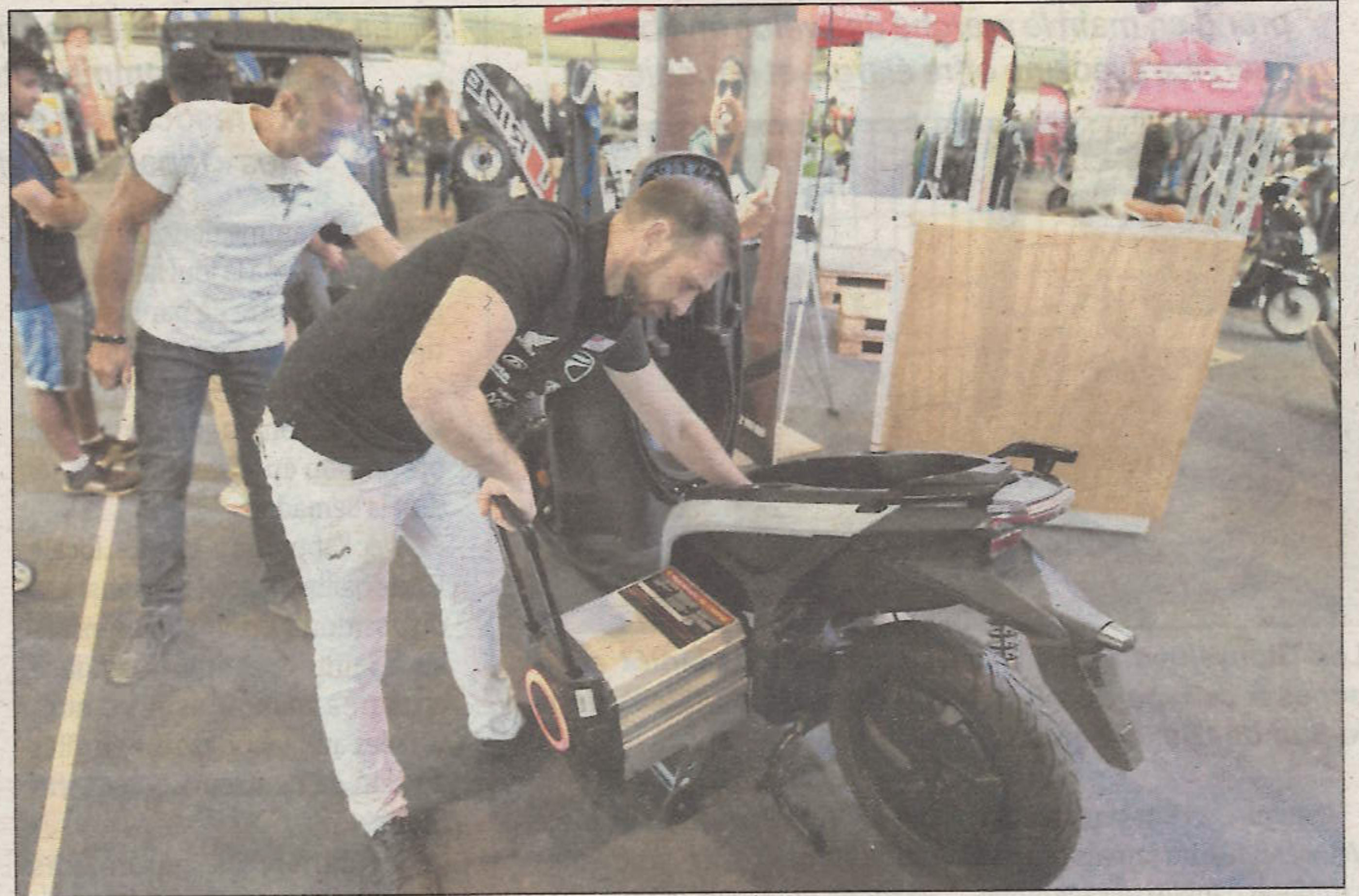
Plus besoin d'emmener son véhicule à proximité d'une prise, il suffit de déplacer la batterie avec soit grâce à une poignée et des roues incorporées sur certains modèles.

En entrant dans le Motor Expo à la Nordev, vous entendrez probablement le bruit produit par les moteurs thermiques qui vrombissent pour impressionner les visiteurs... Mais au milieu de cette marée mécanique, certains exposants ont fait le choix de présenter des véhicules électriques.