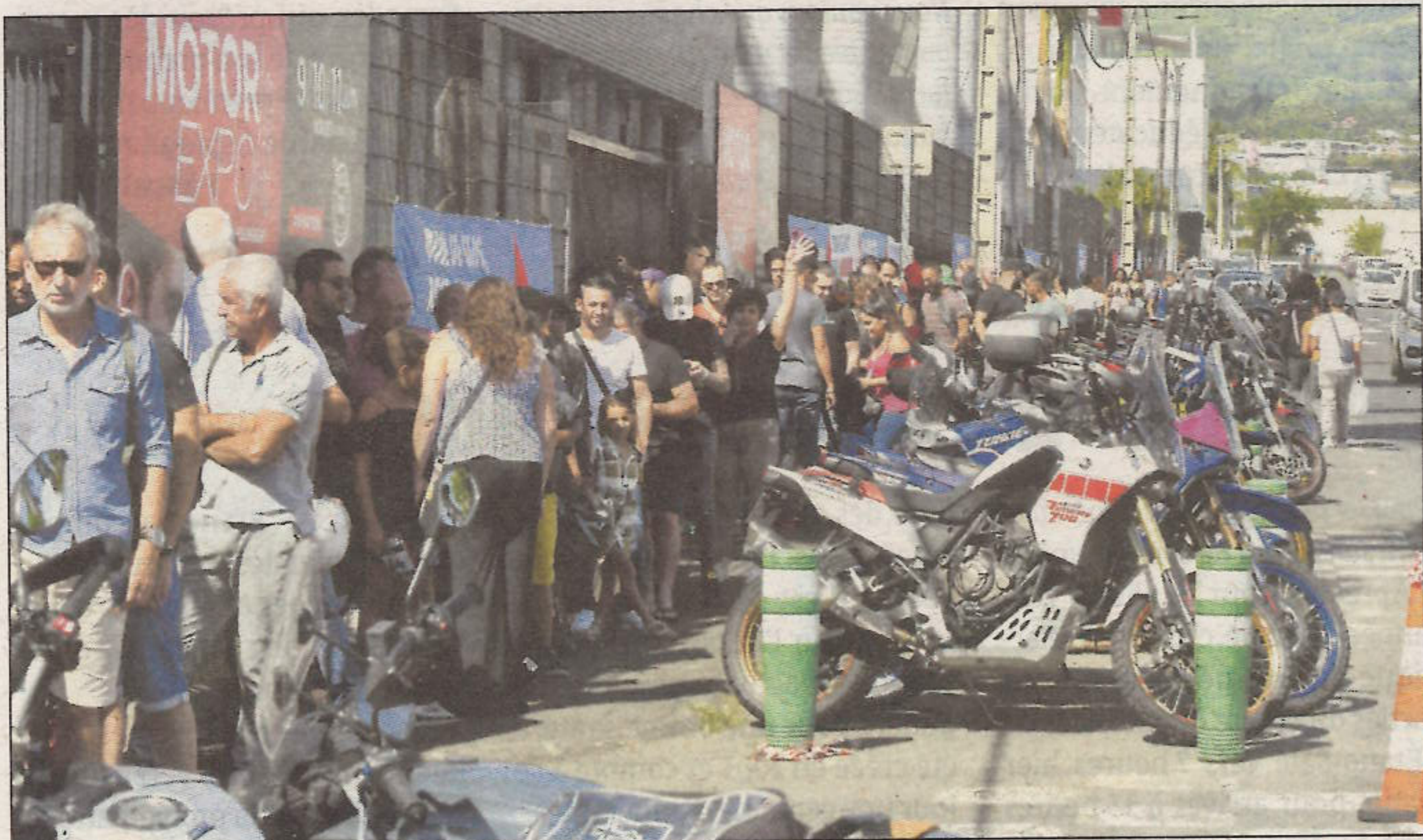
Grosse affluence hier à la Nordev pour ce Motor Expo 2023.