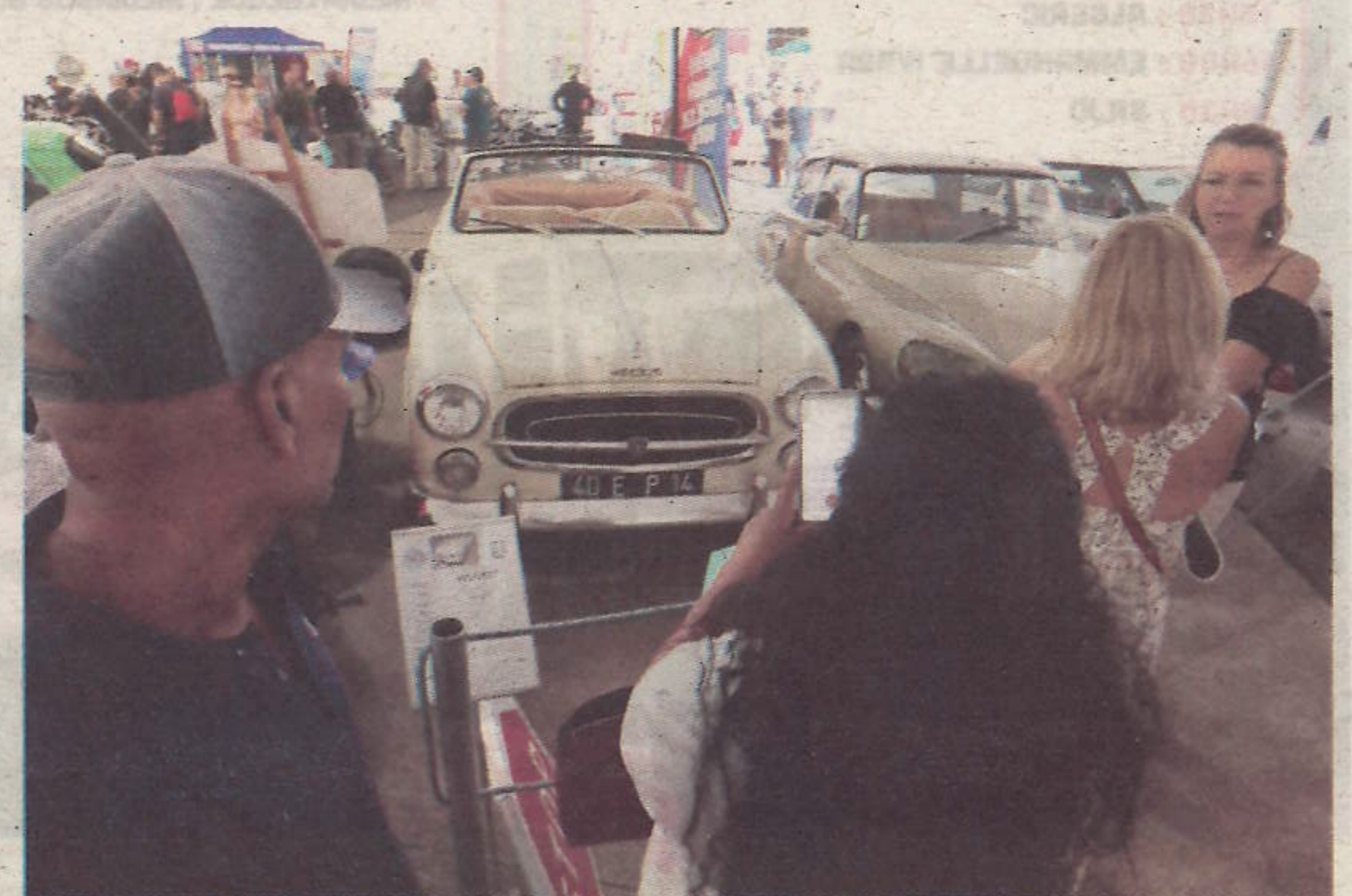
La 403 cabriolet a tourné dans le documentaire Le mythe de la Sirène du Mississippi , avec Paul Belmondo.