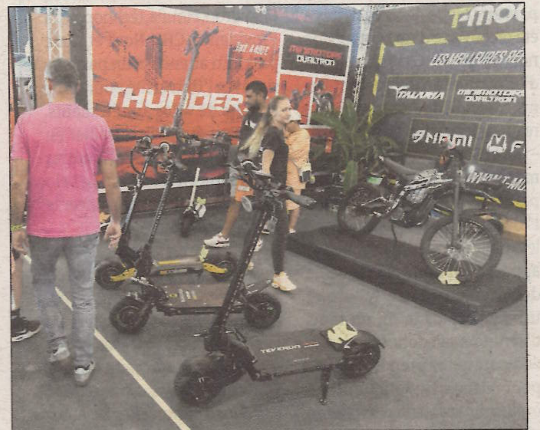
Les trottinettes aussi sont dans la place.