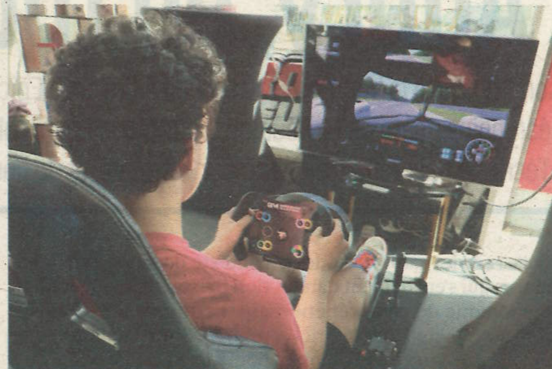
Simulateur de course automobile équipé d'un siège, d'un volant et des pédales.