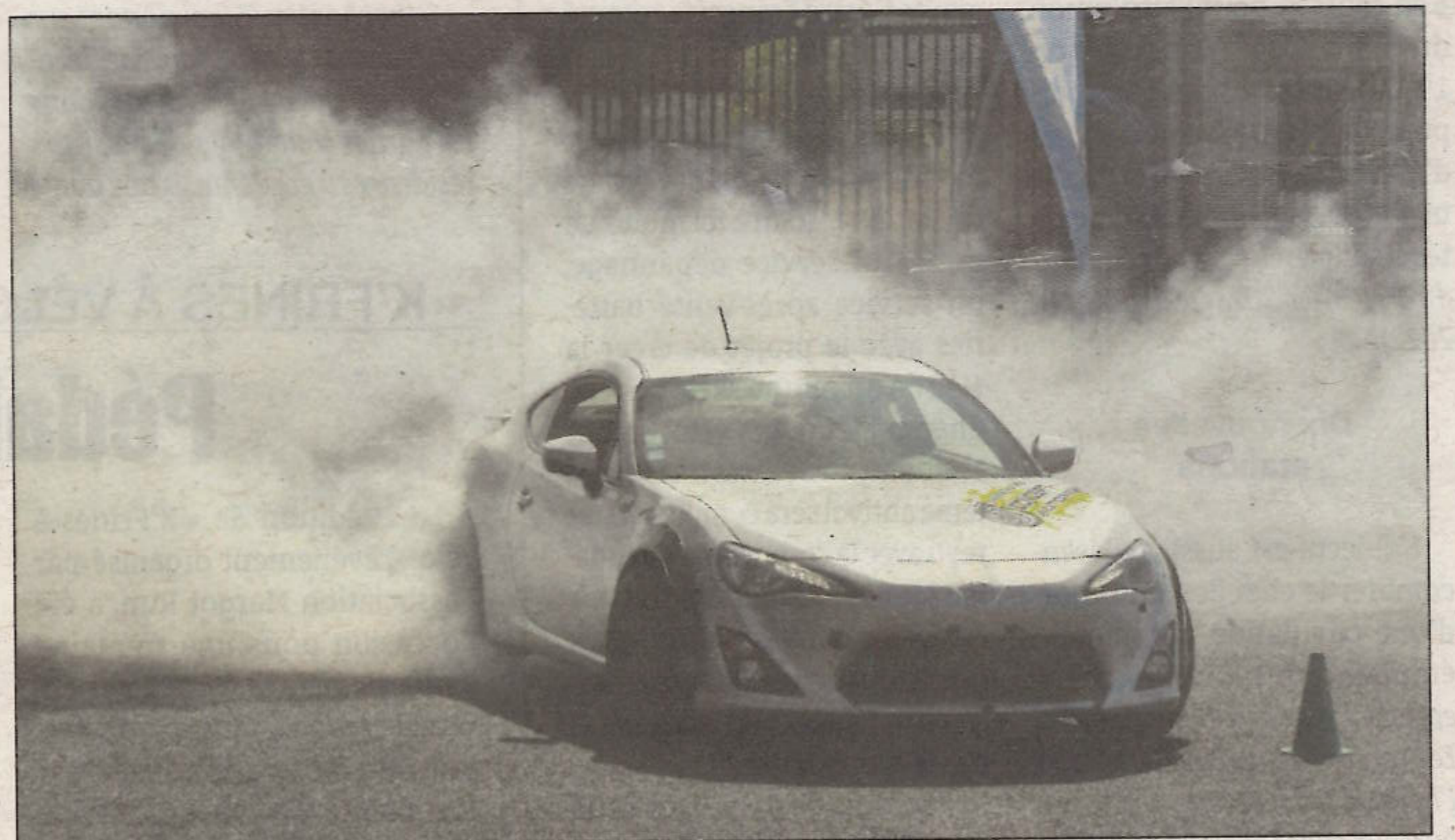
Démonstration de drift.