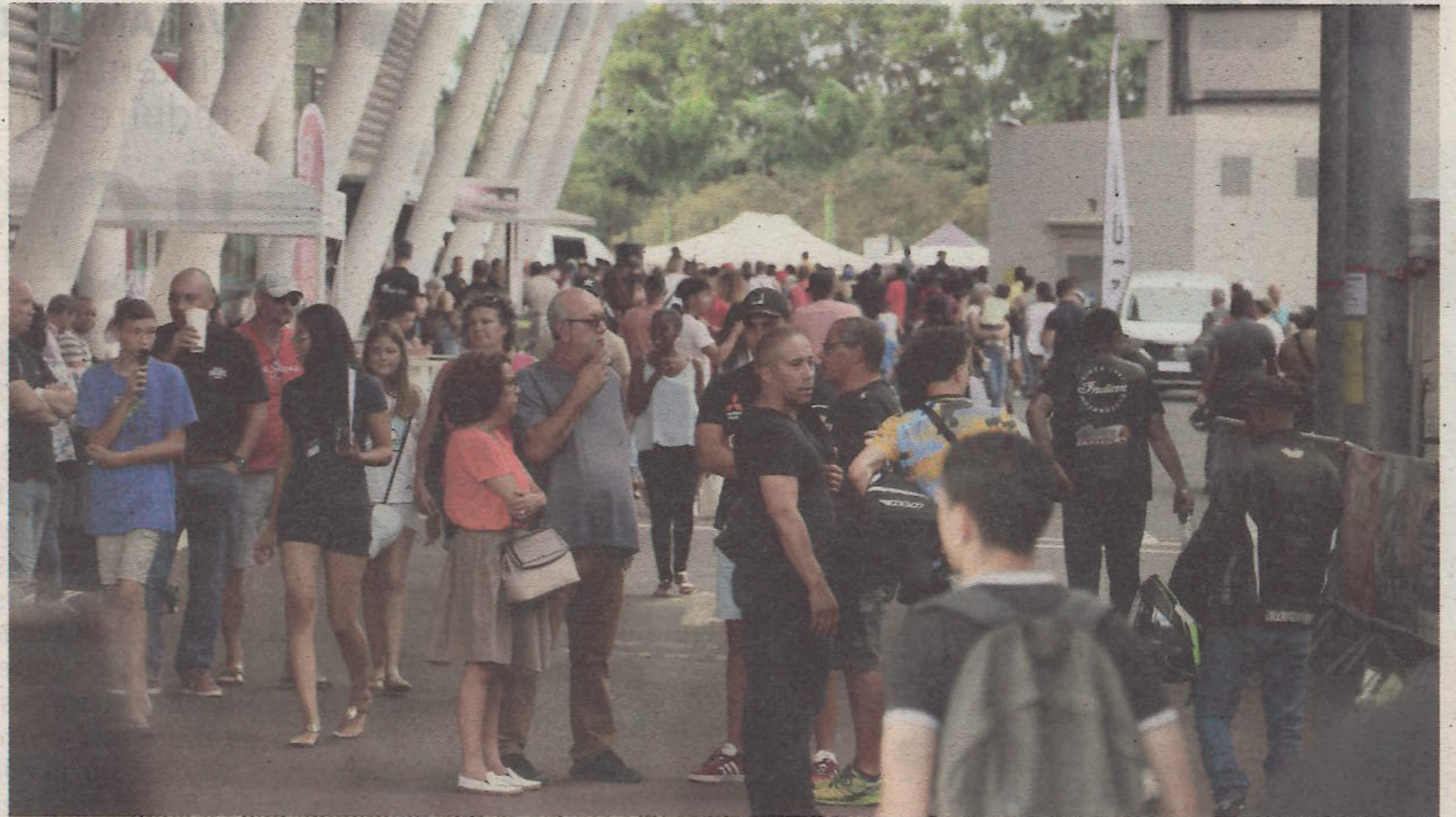
Il y avait du monde, ce week-end à la Nordev, pour le salon Motor Expo.