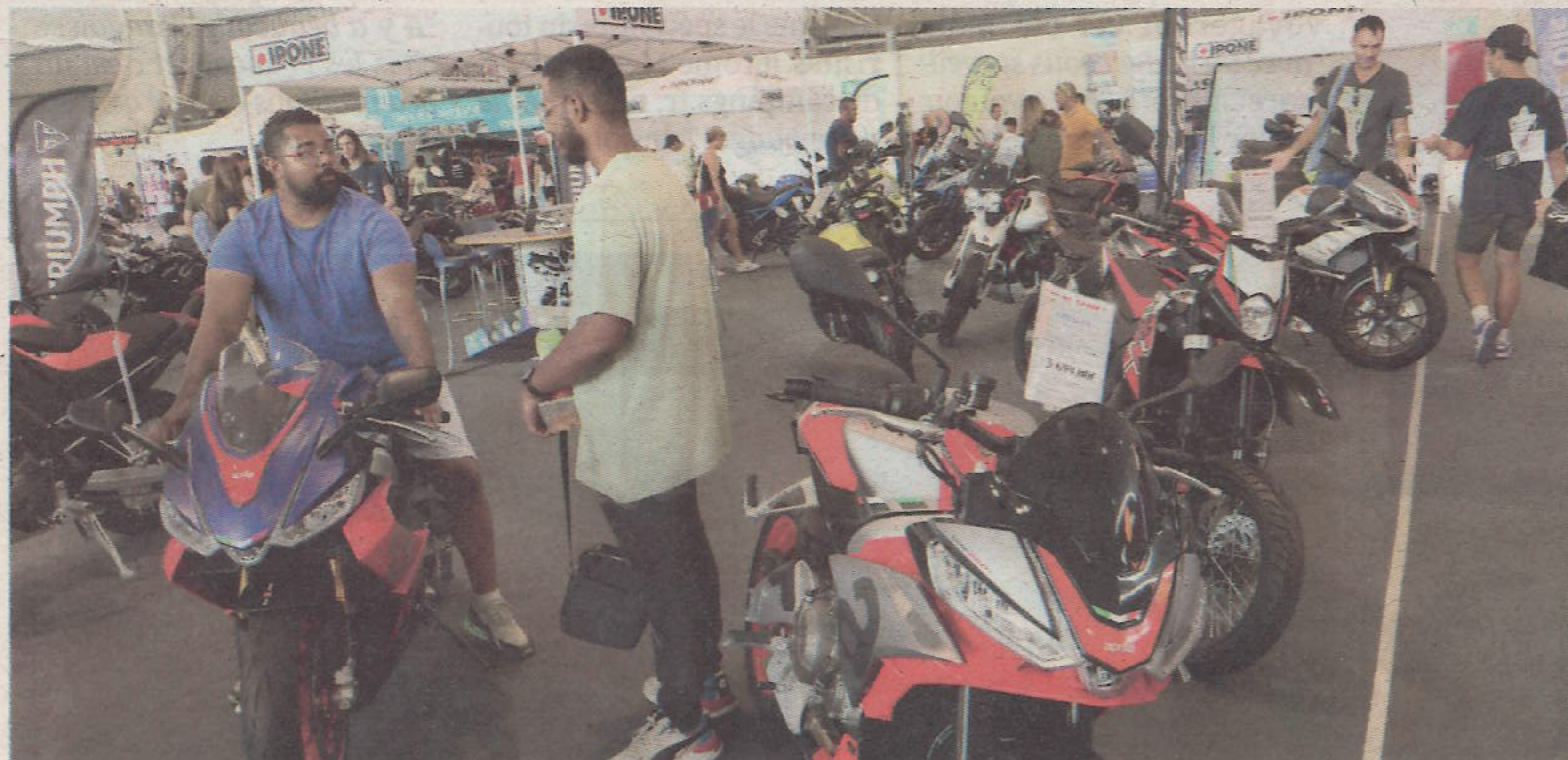
Côté motos, il y en avait pour tous les goûts, ces trois derniers jours, à la Motor Expo.