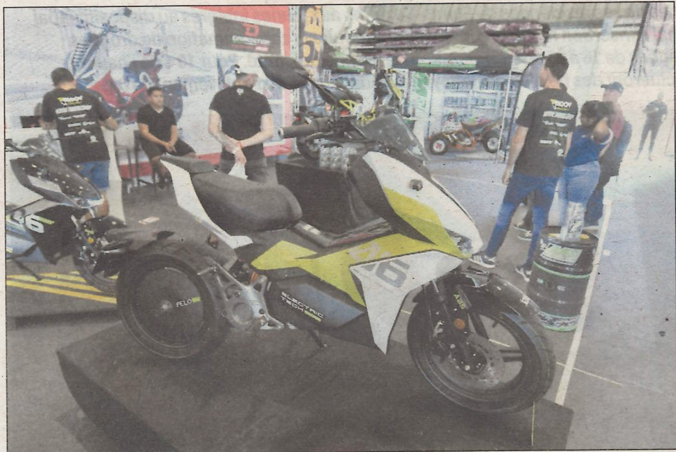
Les modèles électriques ressemblent aux motos que l'on connaît avec des apparences parfois futuristes.

Cette année, les voitures et motos exposées à la Nordev jusqu'à ce soir sur 5 000 m 2 de stands laissent une large place aux véhicules électriques.