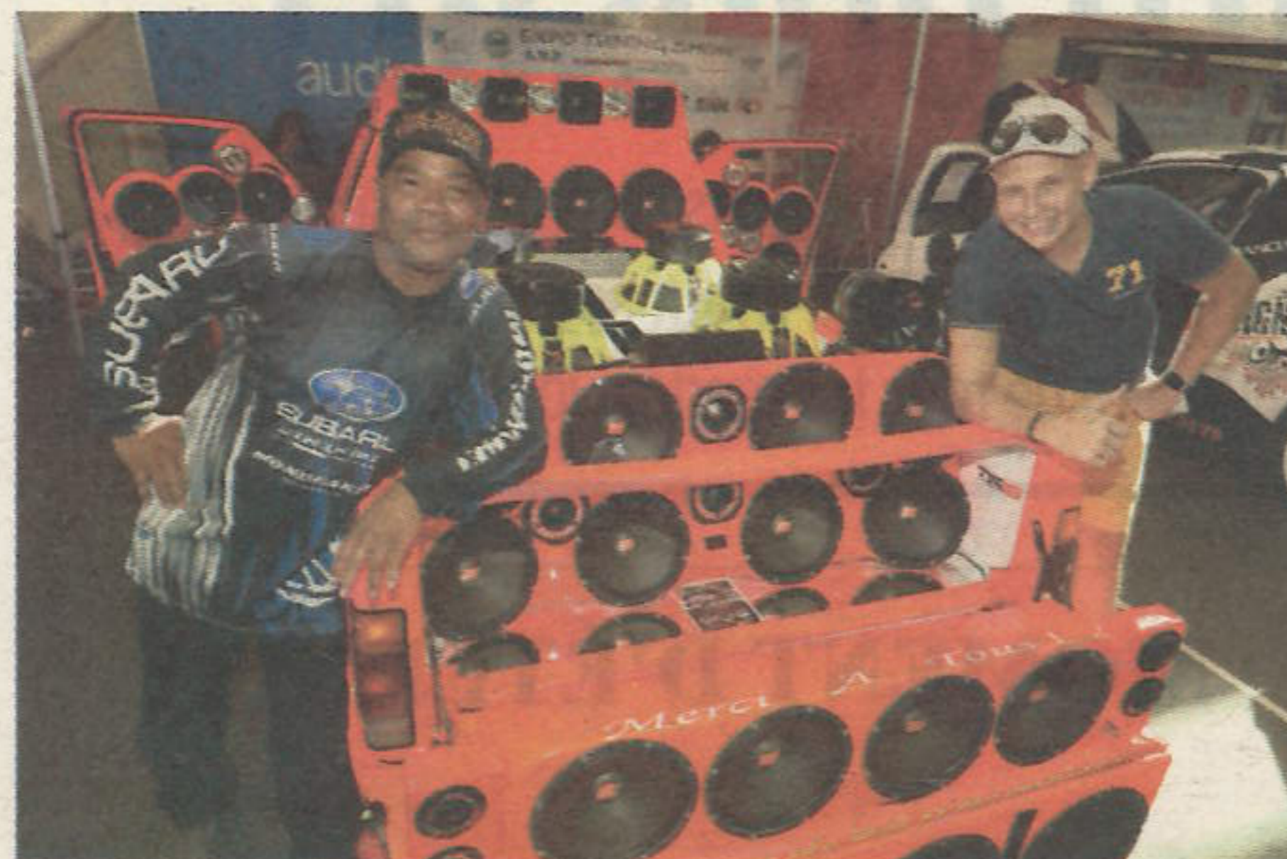
Voiture équipée pour le tuning show. Véhicule équipé pour produire du son, mais qui ne roule pas.

Show stunt à 11h, 14h30 et 17h, exposition de véhicules d'exception, tuning et démo son, drift modélisme et exposition vintage.