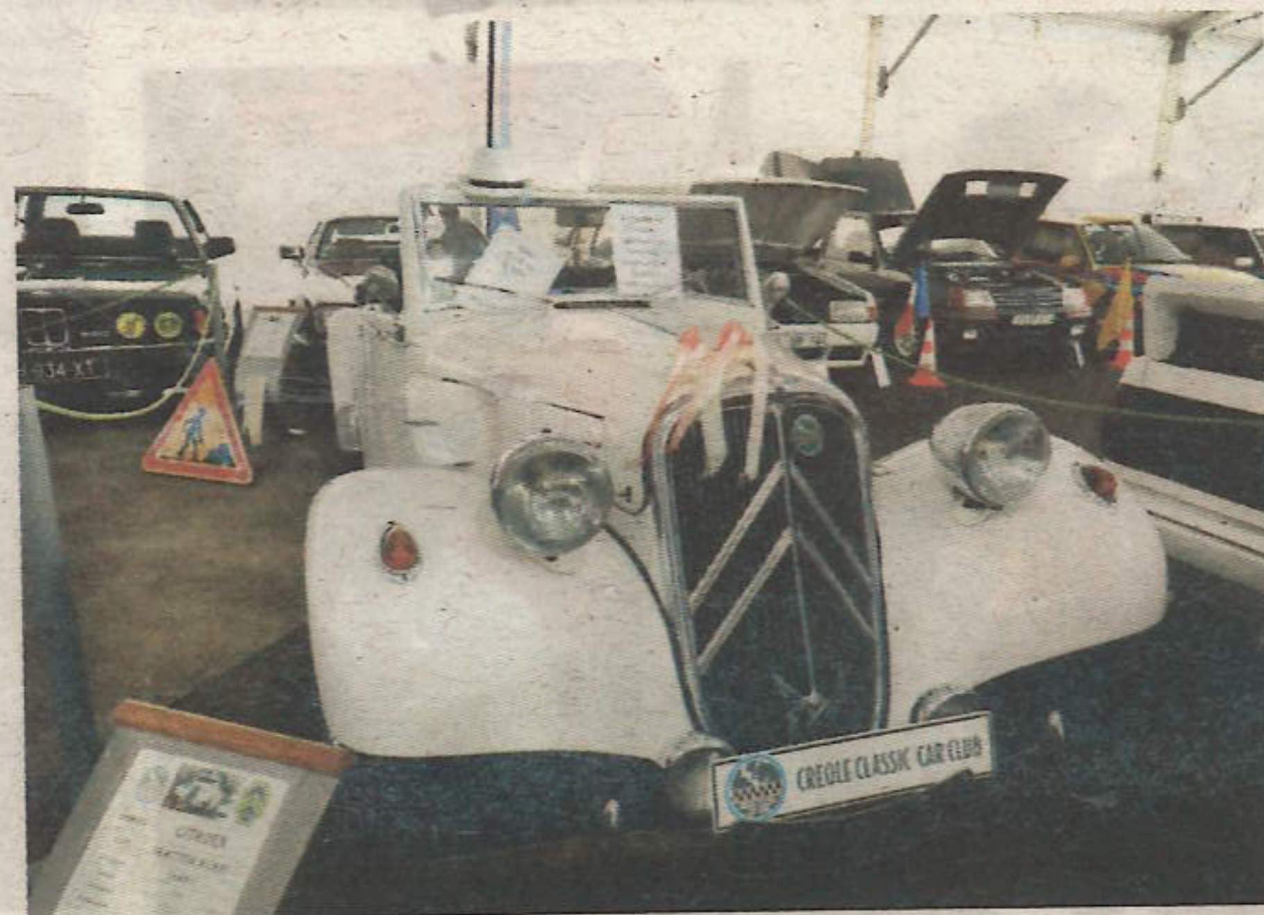
Le salon abrite également une exposition de véhicules vintage.