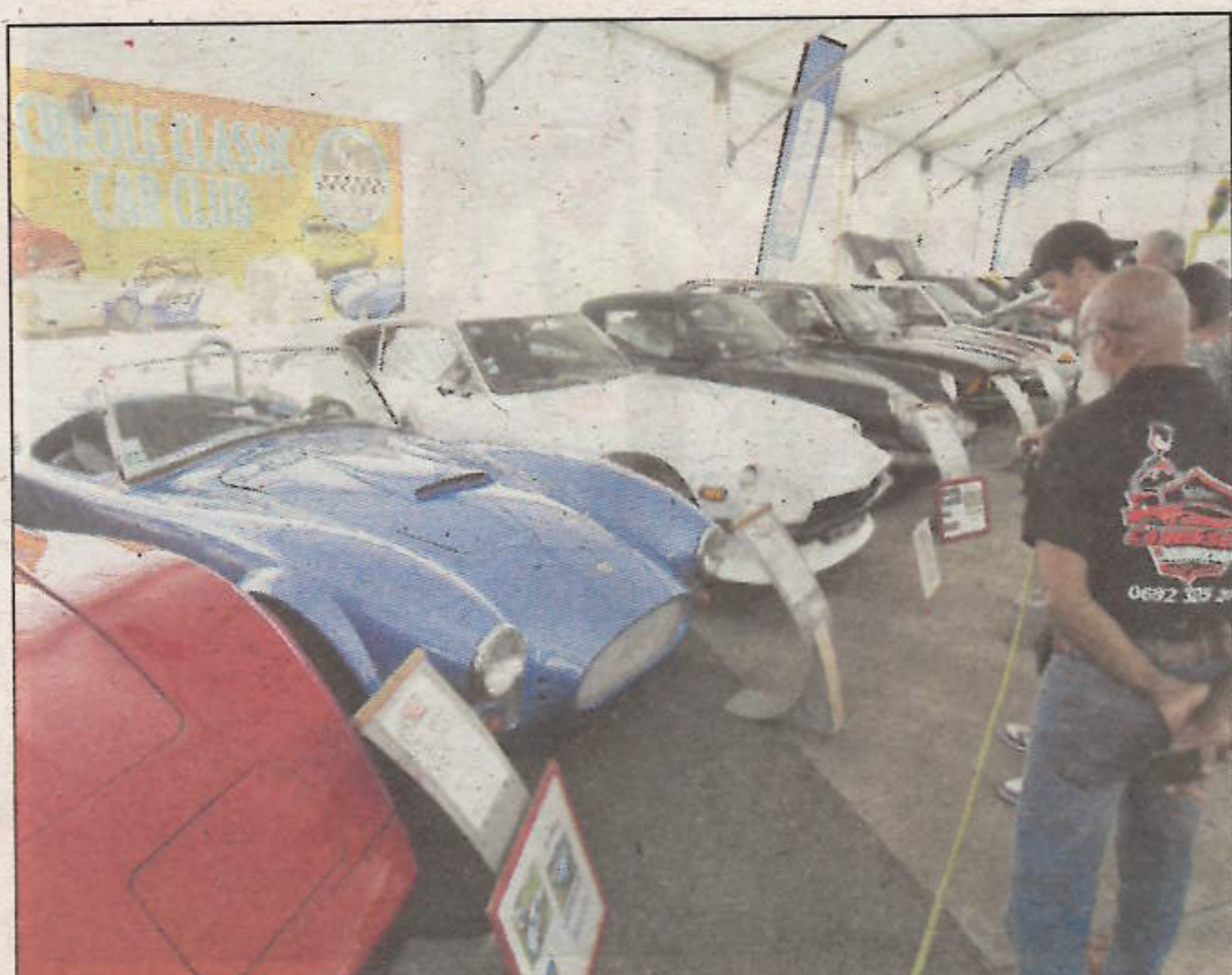
Côté classique, il y a aussi ce qu'il faut.