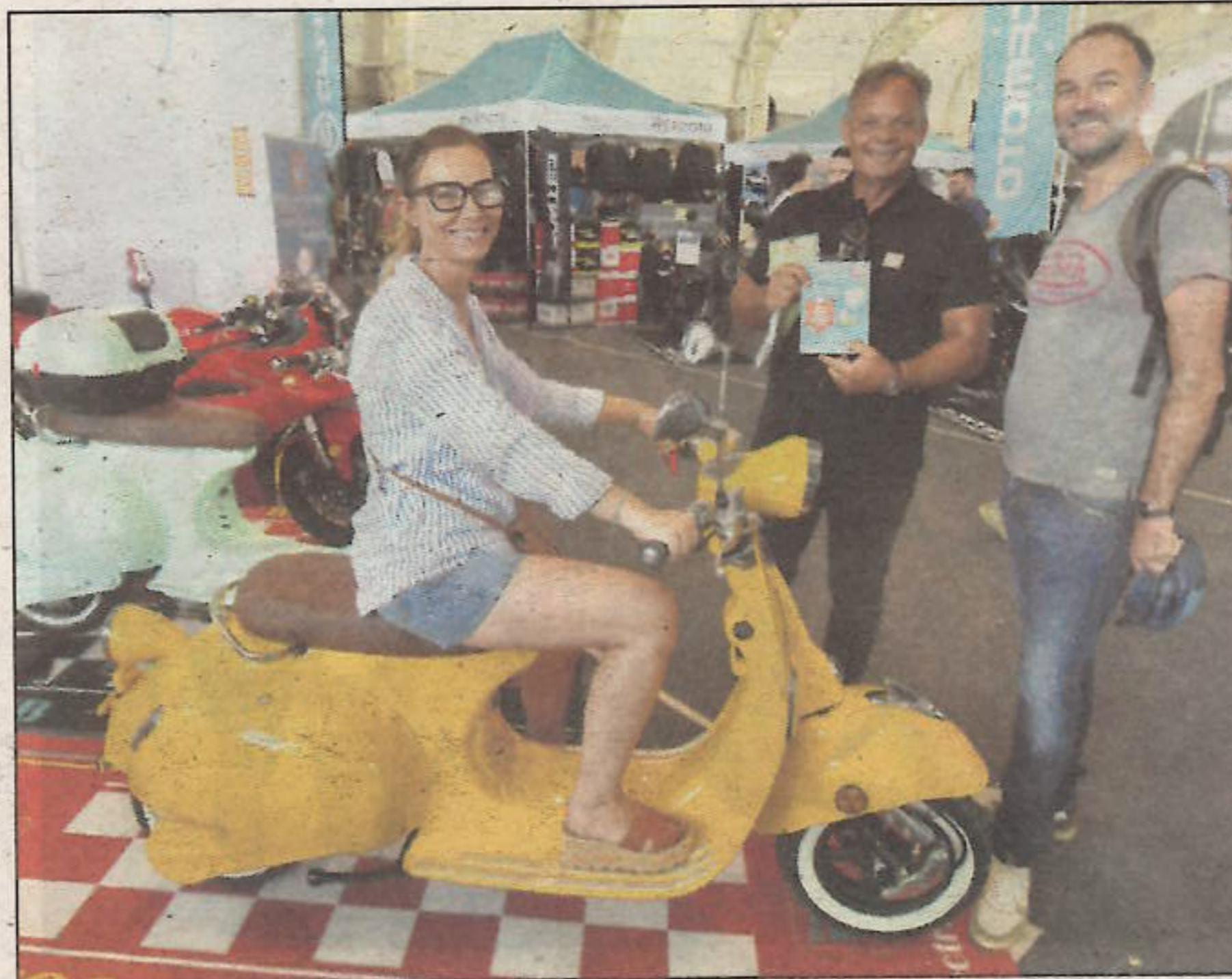
La dolce vita...