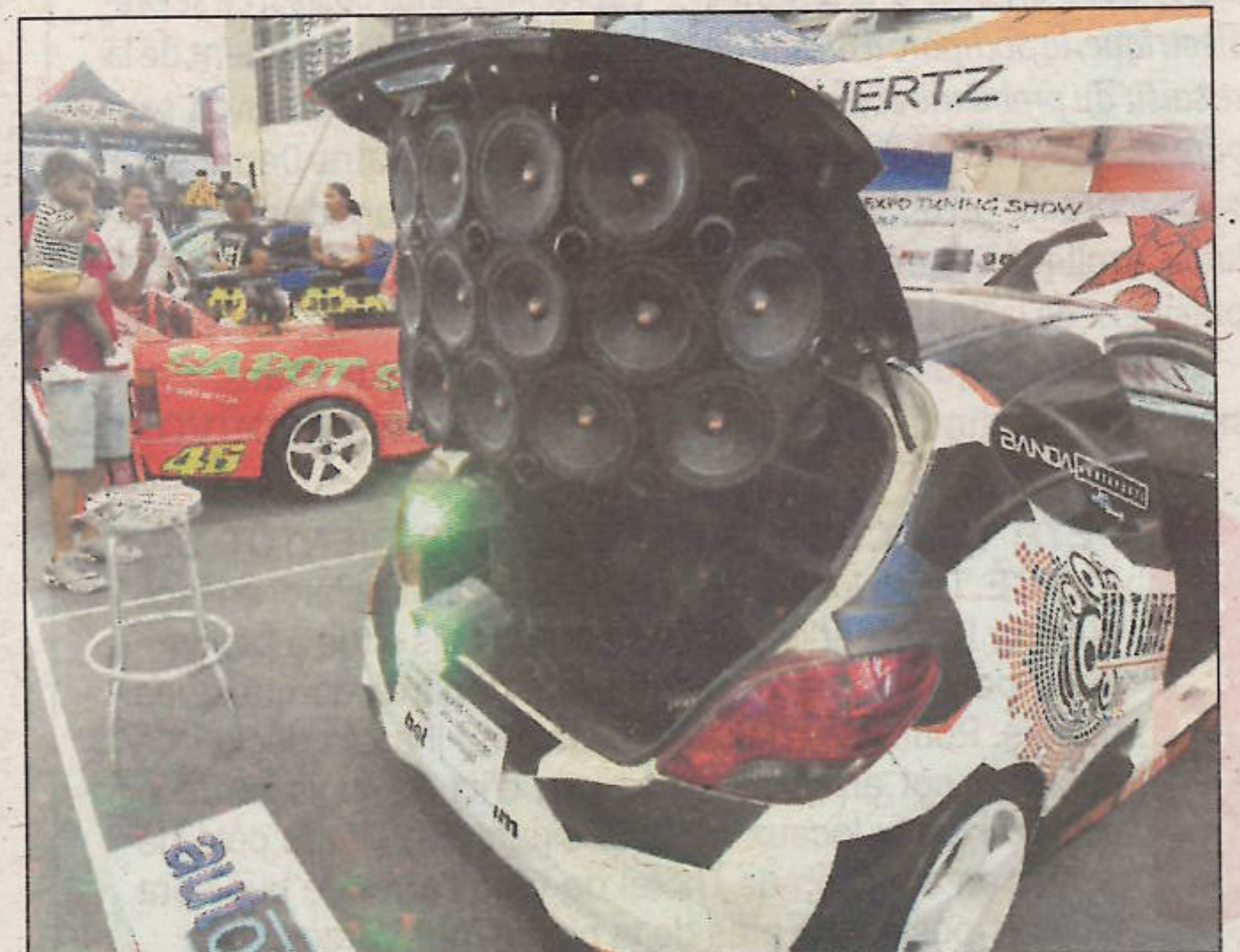
Du gros son.