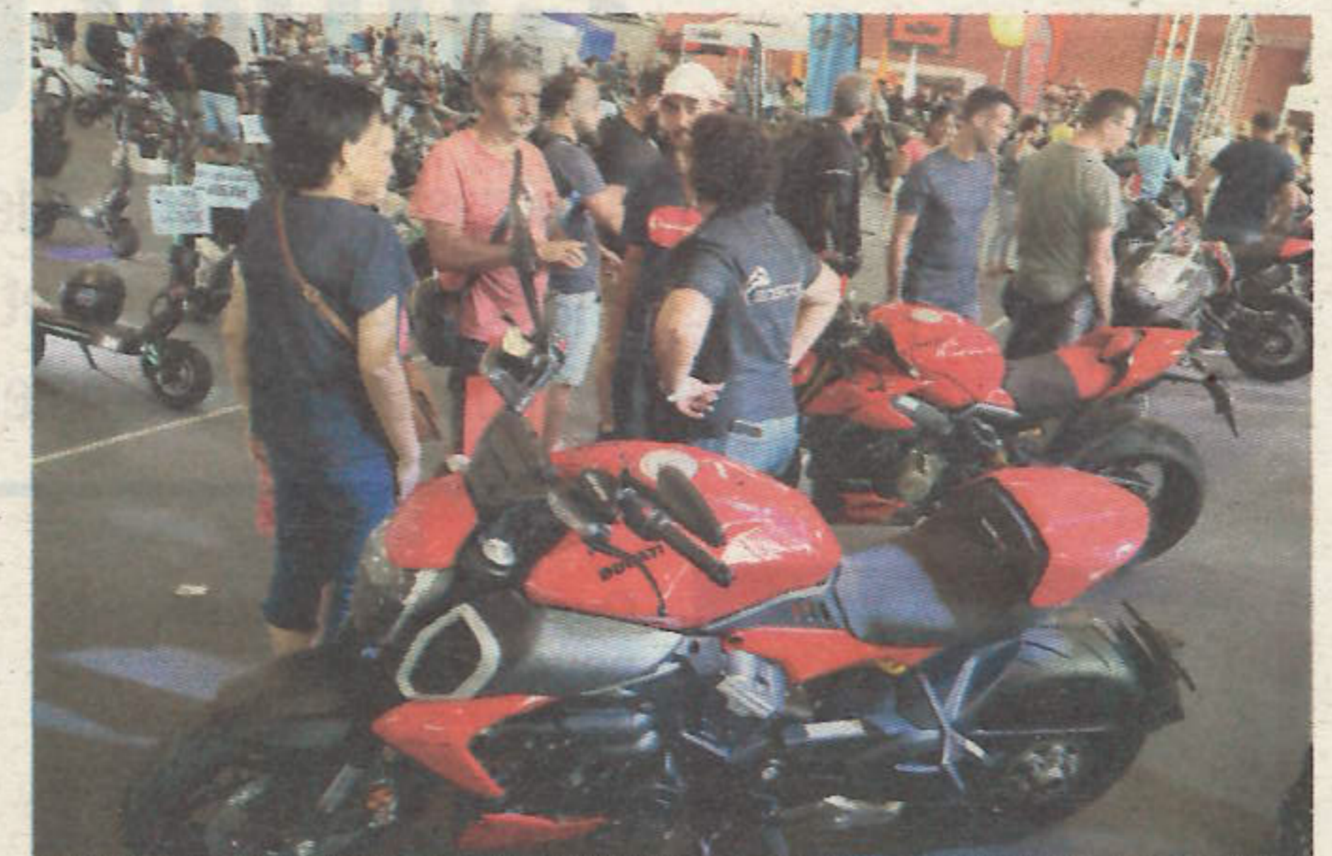
Des motos de différentes marques sont exposées au salon (photos A.D. et J.M.).